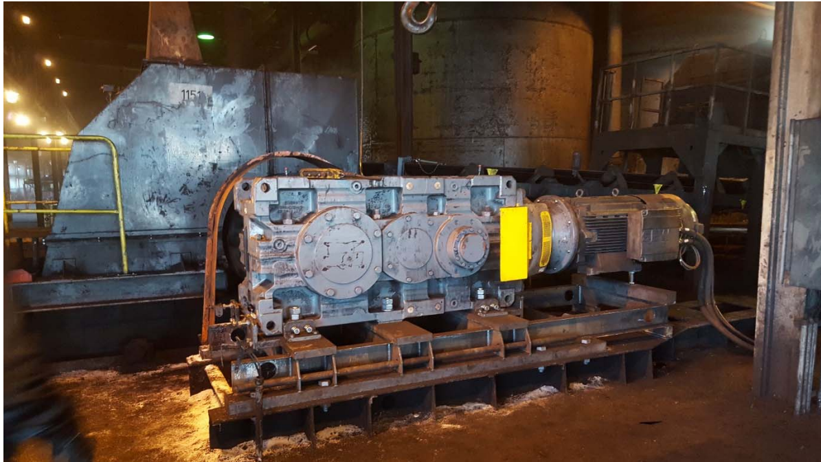
Obr. 3 Pohon dopravníku pol. 1151 po rekonstrukci