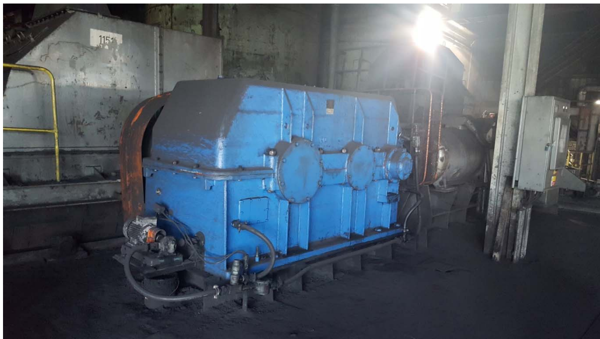
Obr. 1 Pohon dopravníku pol. 1151 před rekonstrukcí